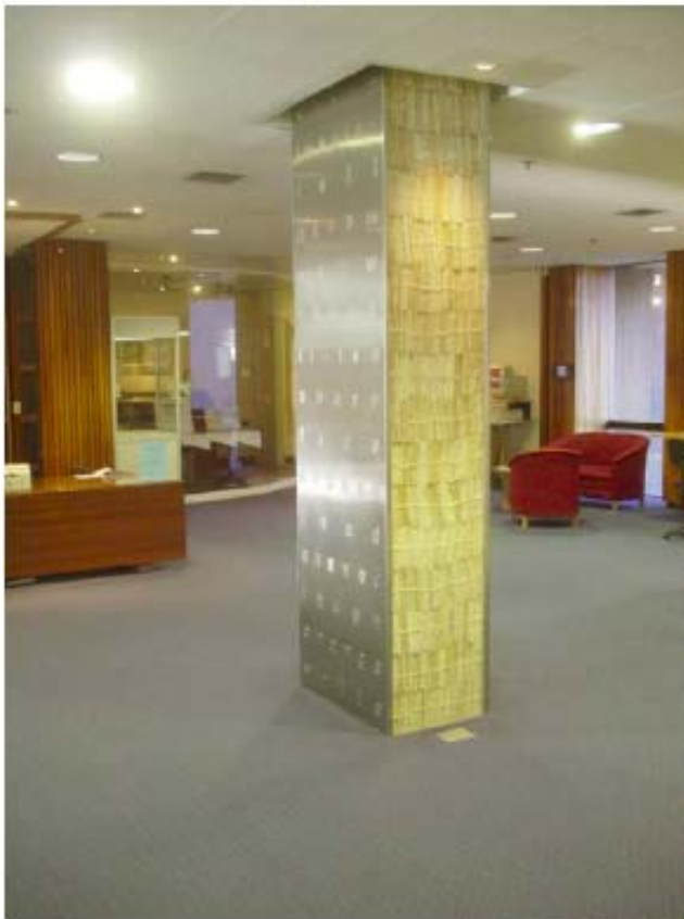
University of Tasmania Library Australia