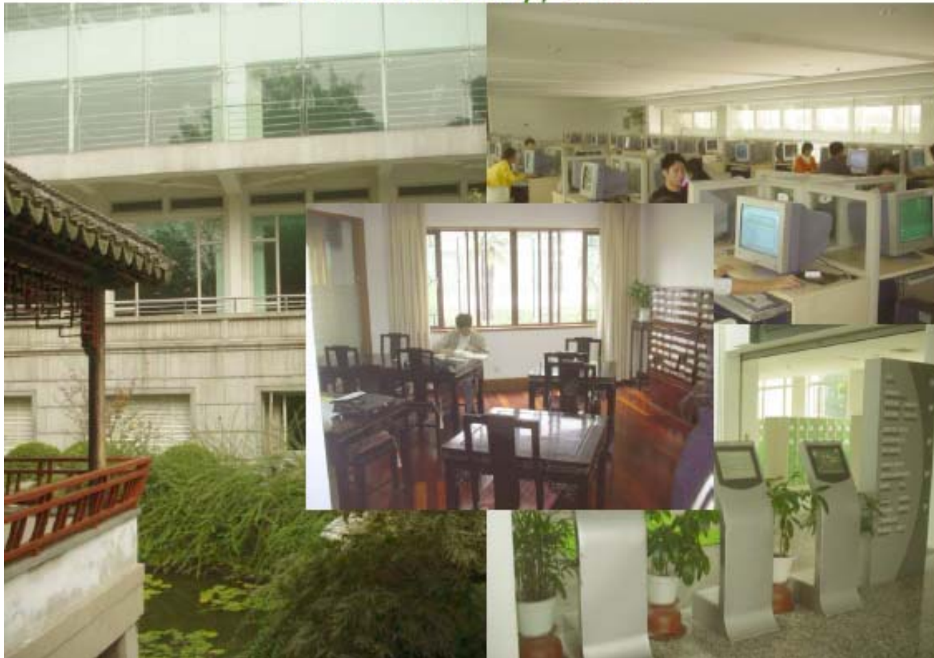
Suzhou Library, China