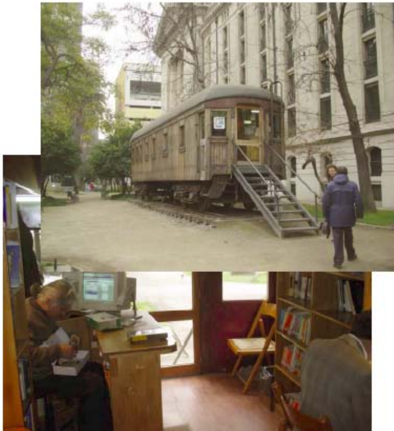
Train Library, National Library, Santiago, Chile