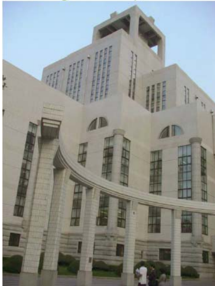
Shanghai Library, China