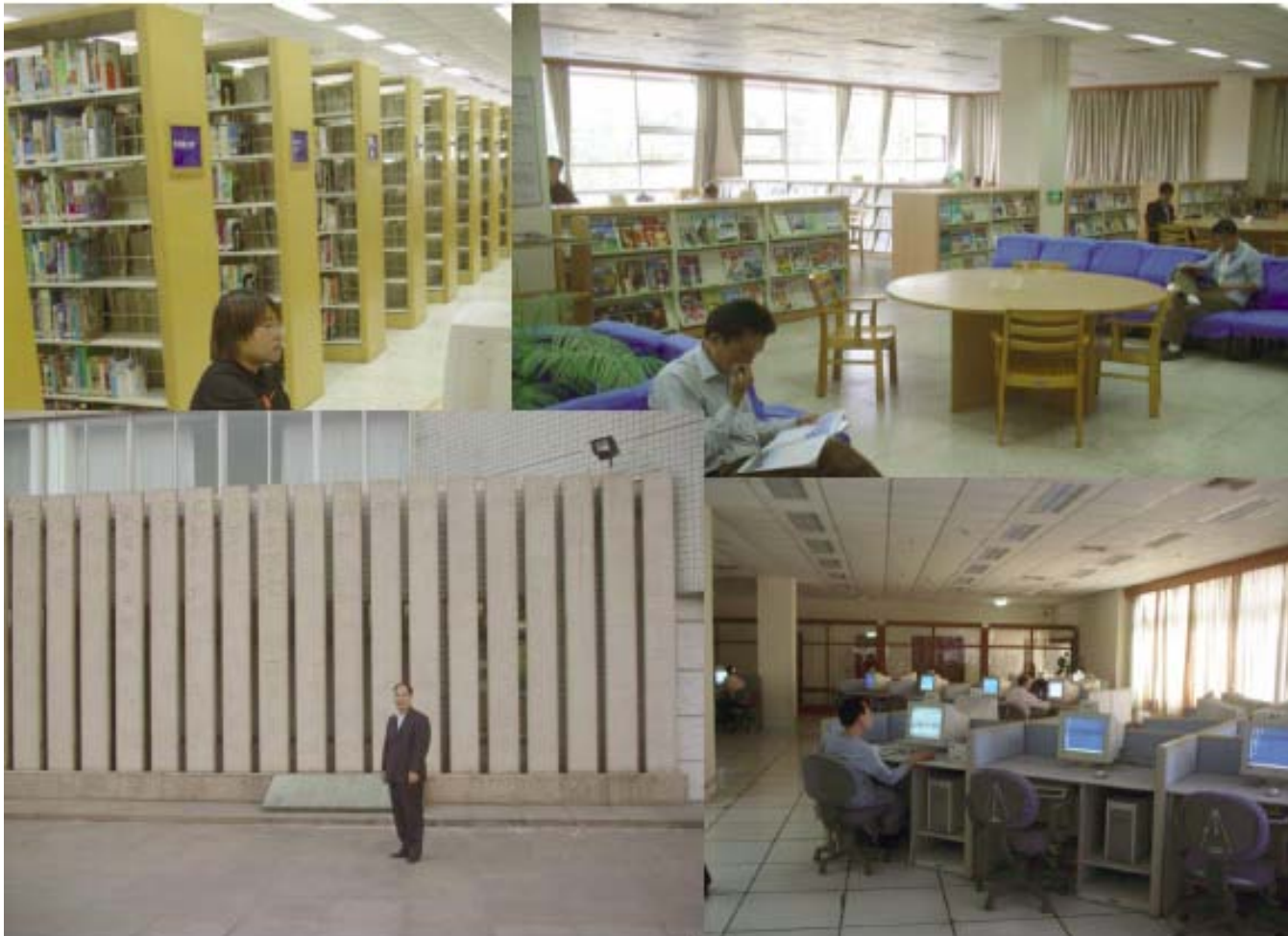
Zhejiang Provincial Library, Hanzhou, China